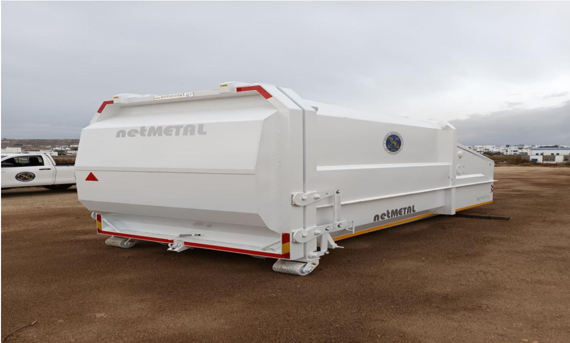
Εικόνα 3: Σύγχρονος συμπιεστής απορριμμάτων του Λιμενικού Ταμείου Μυκόνου για την ενίσχυση της βιώσιμης διαχείρισης αποβλήτων