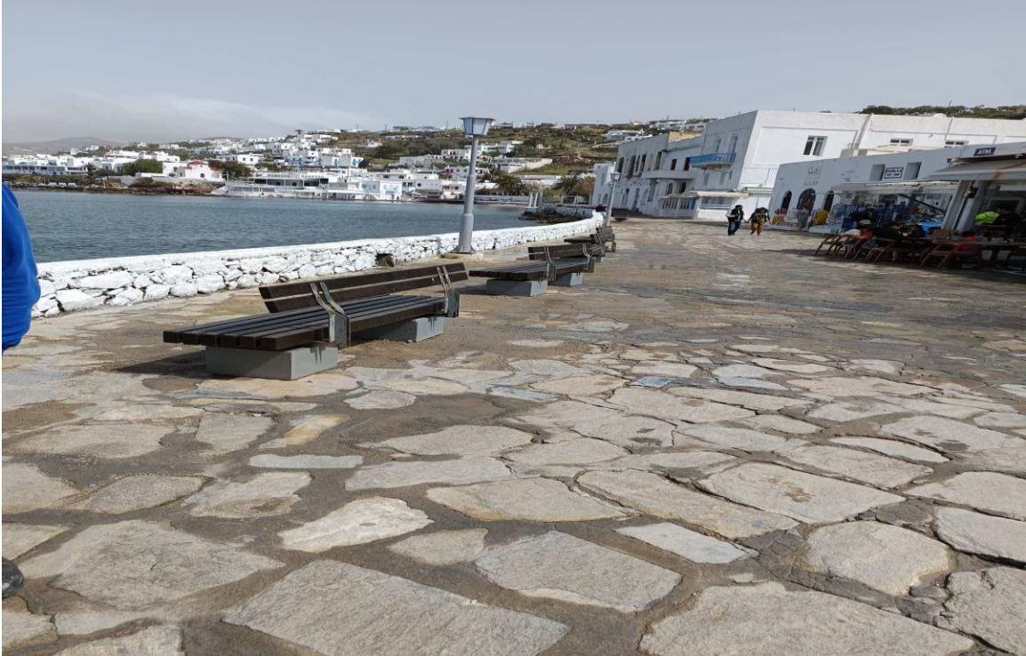
Εικόνα 2: Η παραλία της Χώρας Μυκόνου.

Έμμεσα οφέλη και ευρύτερη συνεισφορά: Η κρουαζιέρα λειτουργεί και ως μοχλός προβολής του προορισμού. Πολλοί επισκέπτες παίρνουν μια «γεύση» της Μυκόνου μέσω μιας ημερήσιας κρουαζιερό-εκδρομής και επιθυμούν να επιστρέψουν για διακοπές μεγαλύτερης διάρκειας. Σύμφωνα με διεθνή στοιχεία, το 63% των ταξιδιωτών κρουαζιέρας δηλώνει ότι έχει επιστρέψει σε προορισμό που πρωτογνώρισε μέσω κρουαζιέρας για πιο πολυήμερες διακοπές[27]. Αυτό σημαίνει ότι η Μύκονος αποκτά επιπλέον μελλοντικούς τουρίστες, οι οποίοι έρχονται αεροπορικώς ή ακτοπλοϊκώς, ενισχύοντας περαιτέρω την οικονομία (διαμονές σε ξενοδοχεία, περισσότερες ημέρες δαπανών κ.λπ.). Επιπλέον, η παρουσία των κρουαζιερόπλοιων φέρνει έσοδα στο ίδιο το λιμάνι (λιμενικά τέλη, τέλη επιβατών κ.ά.), που επανεπενδύονται σε υποδομές.